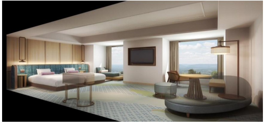
(完成イメージパース)