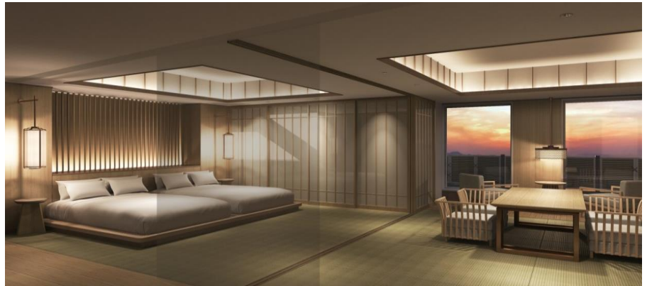
(完成イメージパース)