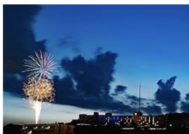
2021年6月29日「ナツガクル」 ※地元有志主催の花火打ち上げ