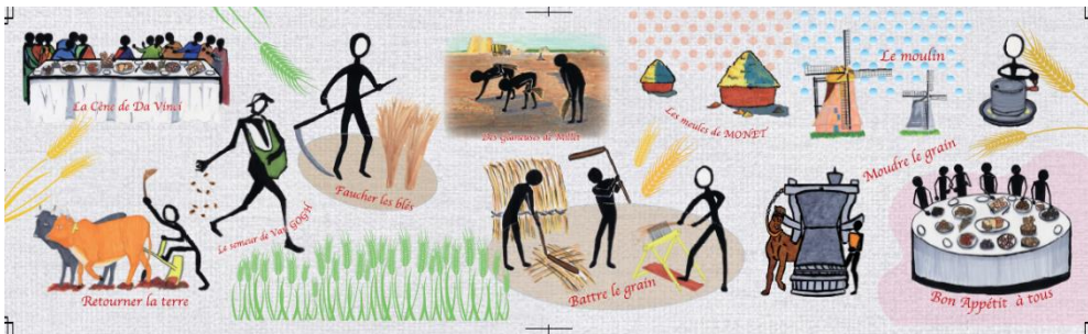
(上)絵画タイトル「小麦から見た文化」

SHIROYAMA HOTEL kagoshima (城山観光株式会社/所在地:鹿児島市/代表取締役社長:東 清三郎)は、開業 60 周年事業の一環として、鹿児島高等学校の美術部に制作を依頼した 2 枚の絵画を、地下にあるベーカリー工場外壁に設置いたします。その完成除幕式を 2023 年 3 月 31 日(金)に実施いたします。